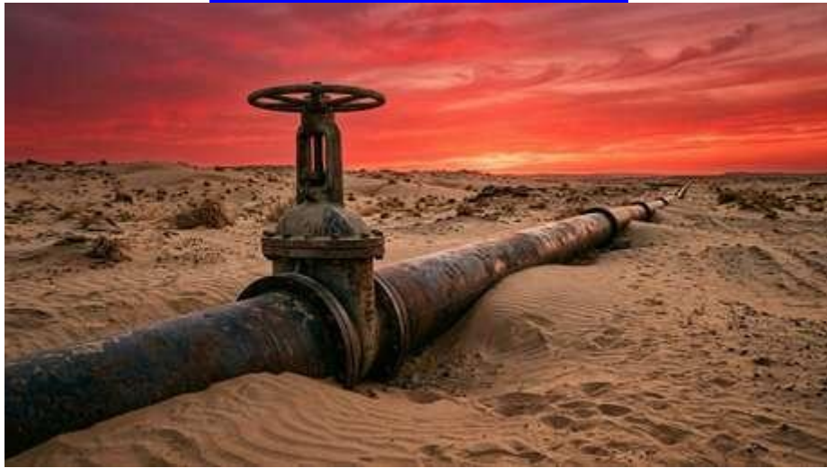
Imagen creada por inteligencia artificial

El frente oculto de la guerra en Irán que amenaza con llegar a los comedores de todo el mundo